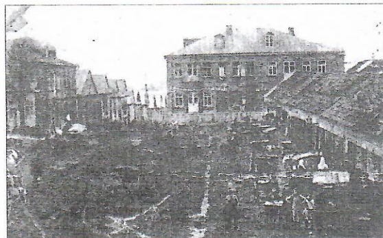
Карэлічы. Рынкавая плошча (1935 г.)

З дакументаў вынікае, што апошняю падзяку Мінскага епархіяльнага вучылішчнага савета за загадванне Запольскімі школамі святар атрымаў у 1913 г., а ў канцы года яго не стала. Магчыма састарэлага святара забраў да сябе адна з яго пляменніцкая жонка ў іншай мясцовасці, і ён аказаўся пахаваным далёка ад дома. Пакуль і гэтак пытанне няма адка: але зразумела, што памяць пра гэтага рупліўца на ні асветы павінна захоўвацца на той зямлі, якой ён аддаў службу многія гады.