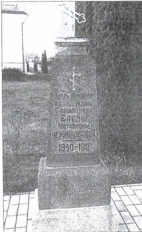
Помнік на магіле Алены Чарнякоўскай